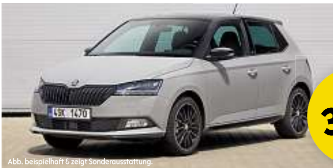
Abb. beispielhaft & zeigt Sonderausstattung.